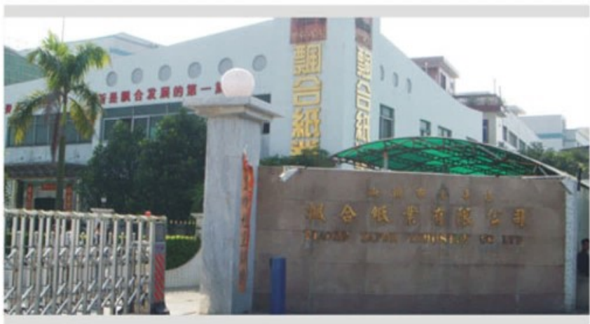
飘合纸业有限公司