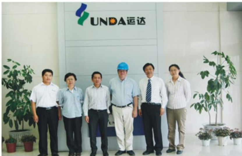
贝利公司专家团队与运达公司有关领导合影