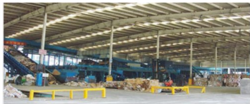
东莞某大型造纸企业使用运达废纸散包干法筛选系统四套

另外他们在广西桂林投资上了一个5万吨箱板纸项目，使用链板输送机，D型碎浆机，高浓除砂器，纤维分离机等设备。