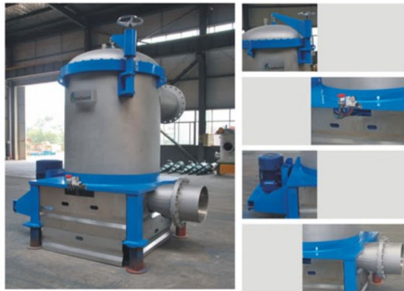
内流压力筛技术参数