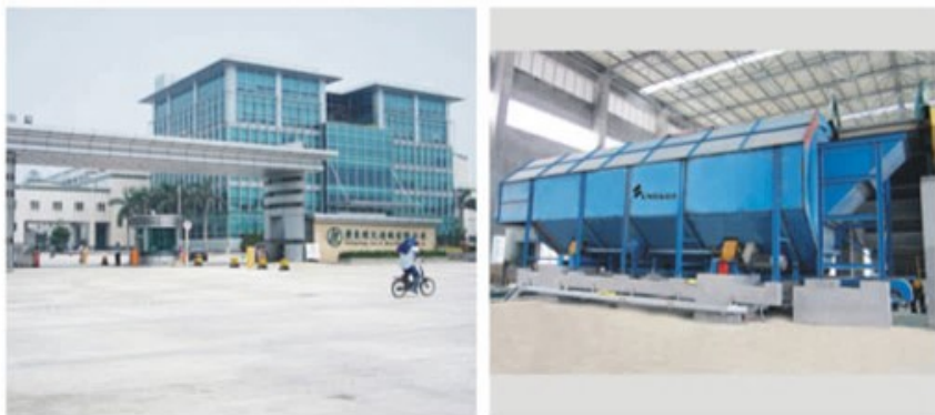
东莞理文纸业有限公司 采用运达散包机