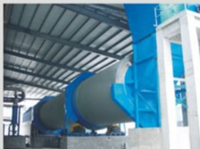
生产20万吨瓦楞纸解解系统