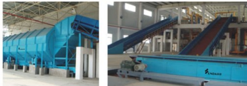
江门明星纸业有限公司 采用运达链板输送机及废纸散包干法筛选系统