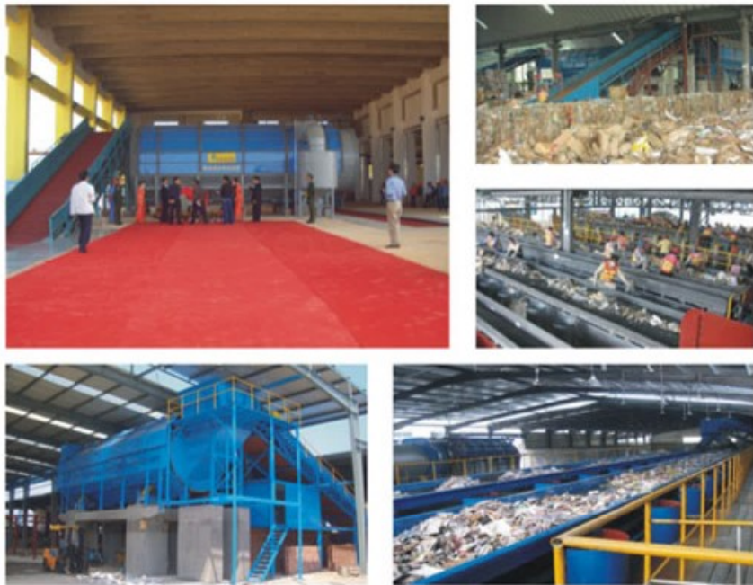
链板输送机技术参数