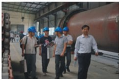
实习生分组参观车间