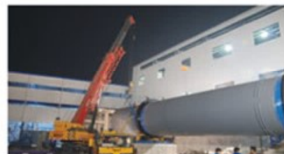
转鼓式碎浆机技术参数